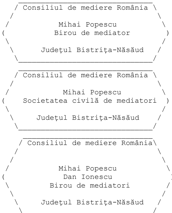
Figura 1Lex : Modelul ștampilei formelor de exercitare a profesiei